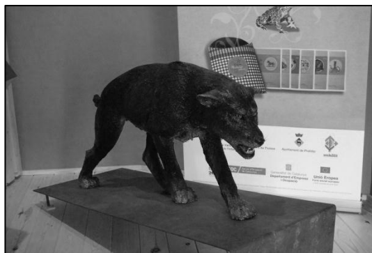
Reproducció del Dip a escala real.

El Dip és una acció més de l'estratègia turística creada entorn de la figura d'aquest ésser mitològic i ha estat finançat a través de la Diputació de Tarragona i l'Associació Nuclear Vandellòs Ascó.