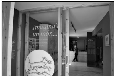
Entrada del centre.