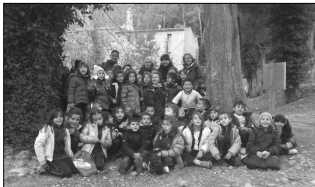
Els nens, nenes i mestres de 1er i 2n de l'Escola Marcel·lí Esquius.