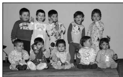
Nens de la llar d'infants durant una actuació.

Com cada any, des de l'escola i la llar d'infants, s'organitza un festival per celebrar el Nadal, on els nens i les nenes fan representacions i actuacions. El festival es farà el dimecres 19 de desembre a les 14:30 a la sala polivalent. Hi esteu tots convidats.