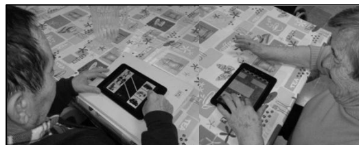
Usuaris del Centre de Dia amb les tauletes.

Els tallers de memòria són una de les activitats que es fan al Centre de Dia de Pratedip, en aquest cas l'eina utilitzada van ser les tauletes tàctils. Van fer laberints, van formar paraules, van relacionar noms amb el dibuix corresponent, etc. Tot i que al principi hi havia certa reticència, ràpidament van familiaritzar-se amb elles. Es pensa repetir l'experiència donada la bona acollida de l'acció.