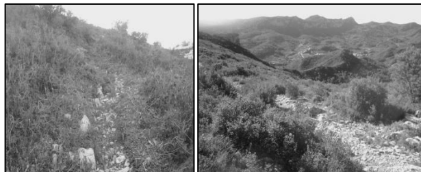
Imatges de les tasques de desbrossat i estat actual del camí

Sembla que l'hivern hagi arribat de cop. La setmana passada la començàvem amb temperatures primaverals i avui tenim una temperatura mínima de 4,3°C. Però potser el més destacable ha estat la quantitat d'aigua que ha caigut des del divendres passat a la nit. En total, 219 litres per metre quadrat, que representa la meitat d'aigua de pluja que cau en tot l'any a les zones mediterrànies. Les pluges van començar divendres a la nit i va estar plovent quasi ininterrompudament fins dilluns. Les dades meteorològiques del poble són recollides per l'observador meteorològic Antoni Sabaté.